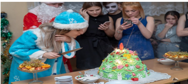
Новый год 2019