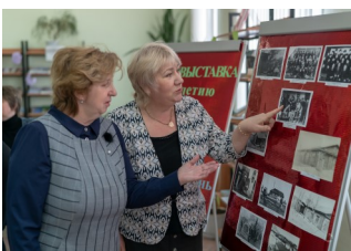
Выставка в библиотеке