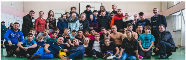
День здоровья - «Workout»