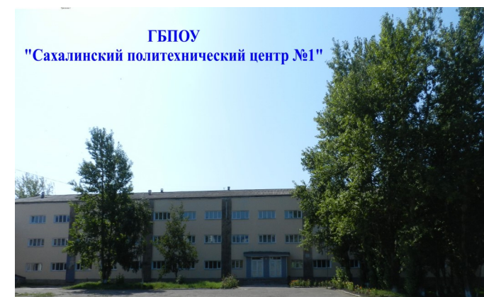
ГБПОУ "Сахалинский политехнический центр №1"