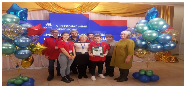
V Региональный чемпионат 2019 год